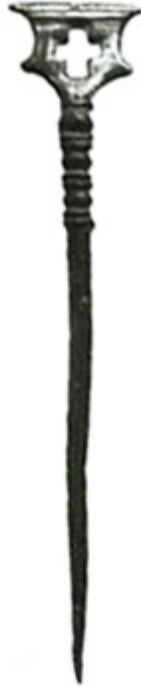
Рисунок 1 Бронзове писало XII–XIII ст. зі Львова

Інформацію про результати розкопок у різних частинах Львова і, в тому числі, згадку про цю знахідку опубліковано в короткому інформаційному повідомленні (Багрий, Могитич, Ратич, Свешников, 1976, с. 298). З того часу кількість подібних виробів, знайдених в українських ранньосередньовічних містах та на сусідніх територіях, відчутно збільшилася, що дає змогу розглянути львівську знахідку в ширшому контексті.